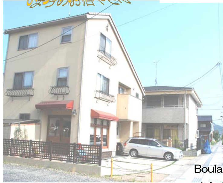
小粋な3階建てのベージュの建物が目印