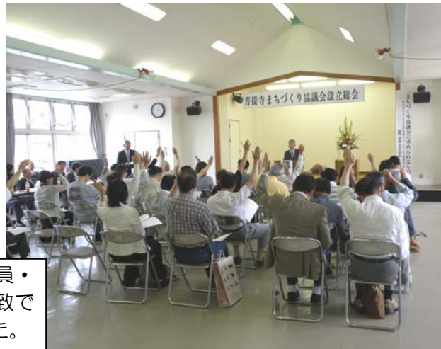
各区より約40名の代議員・運営委員の参加。満場一致で可決。白熱した総会でした。

《 活気ある菩提寺 》《 地域ブランドを開発して自立する菩提寺 》に向けて、皆さんと一緒に頑張っていきたいと存じますので、どうぞよろしくお願い致します。（設立総会、就任挨拶より抜粋）