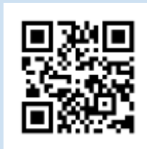
菩提寺まち協ホームページ

どうぞよろしくお願いたします。また、ホームページでは案内や活動議事録等を随時更新しています。ホームページにも訪問ください。