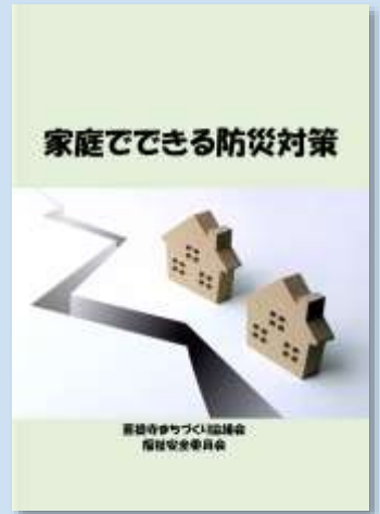
写真は平成30年4月に各戸配布いたしました「家庭でできる防災対策」冊子