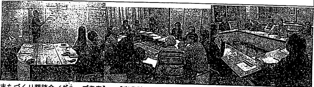
【まちづくり懇談会／グループ発表】

菩提寺学区では、今年6月の『まちづくり協議会（仮称）』設立に向けて準備中ですが、菩提寺の豊かな自然と先人が残してくれた歴史と文化の調和したまちづくり、そこに菩提寺ならではの地域ブランドを育み、湖南省の中でキラリと光る《活気と夢のあるまちづくり》を目指して欲しいと思います。平成22年度末には、菩提寺コミュニティセンターの竣工も計画されており、学区住民のまちづくりの拠点としても愛され活用される施設にしたいものです。