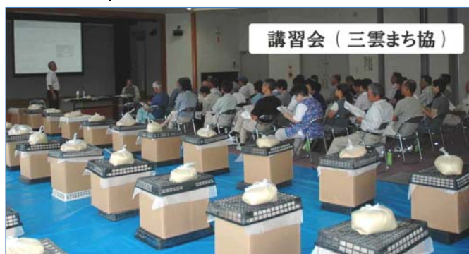
講習会 (三雲まち協)

なお、生ごみリサイクルの講習を希望されるサークル・団体を募集しています。詳しくは下記までお問い合わせください。