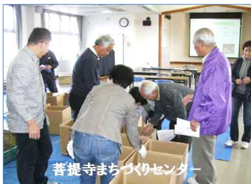
菩提寺まちづくりセンター

の循環を目的としたフリーマーケットの開催や竹林の整備などの事業を通して、環境にやさしい循環型社会の構築に取り組んでいます。皆様のご理解・ご協力をお願いします。