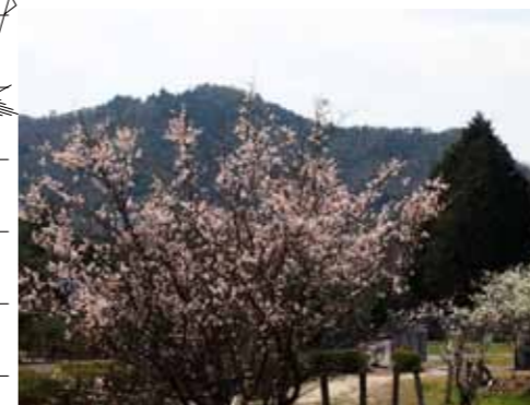
梅林が駐車場に変わる