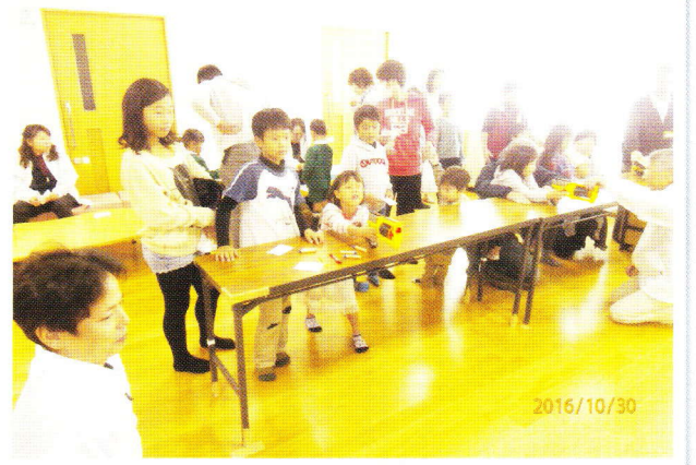
【まちづくりフェスタ(ハリキリンピック)】

子ども育成には時間と人手が必要です、どうか地域の皆様ご協力をよろしくお願い致します。