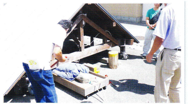
【倒壊家屋からの救出訓練】

突発的に発生する自然災害に対して、菩提寺地域での対処や各家庭内での備えを冊子に示し、各戸に配布して有事に対応できる地域を目指します。